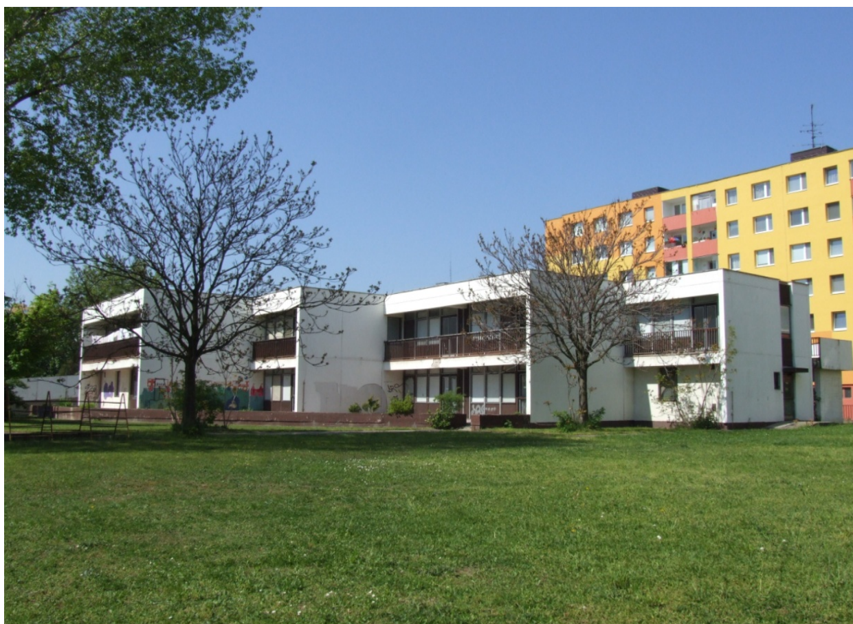
budovy na Haanovej ul. 36 – 38