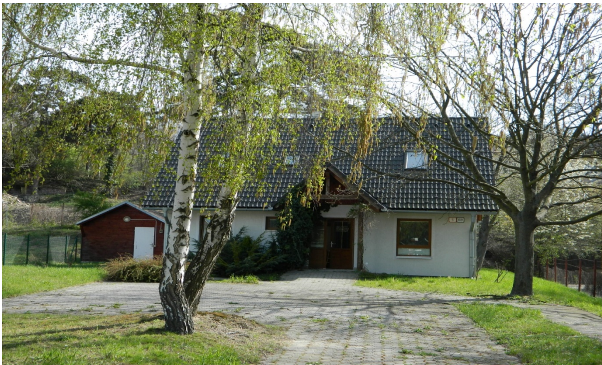
Objekt „bytovka“ súpísne číslo 1787 (parcelné číslo 2580/2)