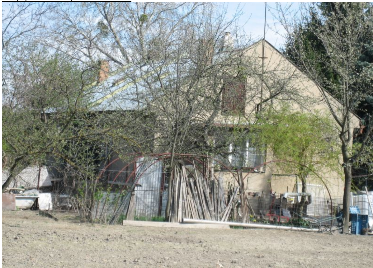
dvojbytovka – súpisné číslo 952