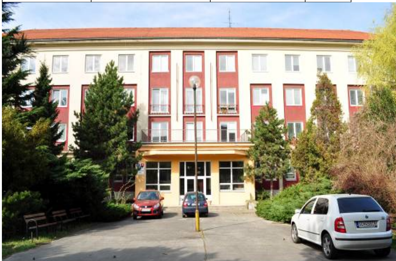
Hlavná budova, súpisné číslo 1531