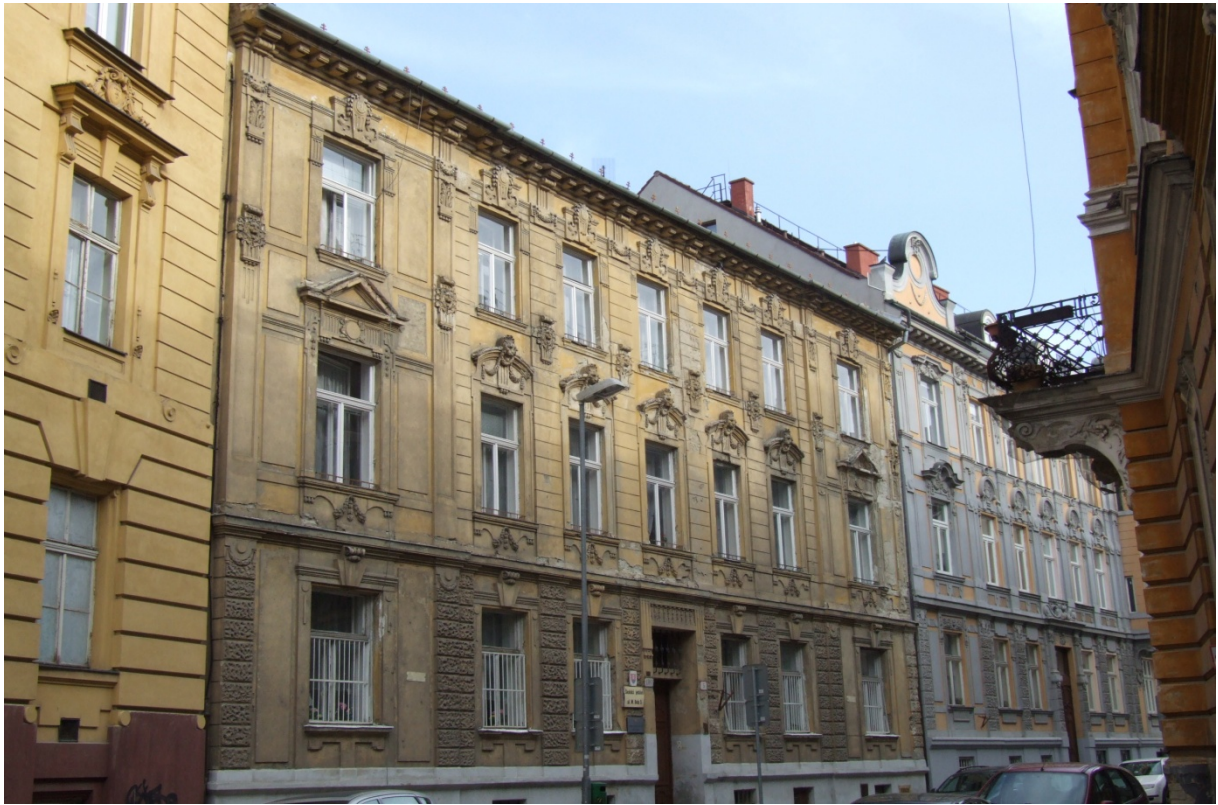
budova Konzervatória – Konventná 4