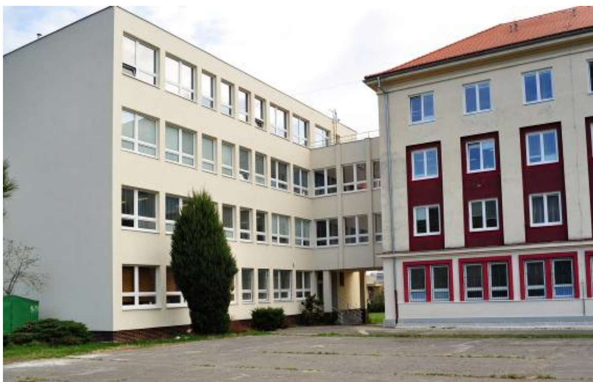
Ostatné stavby - prístavba, súpisné číslo 1531