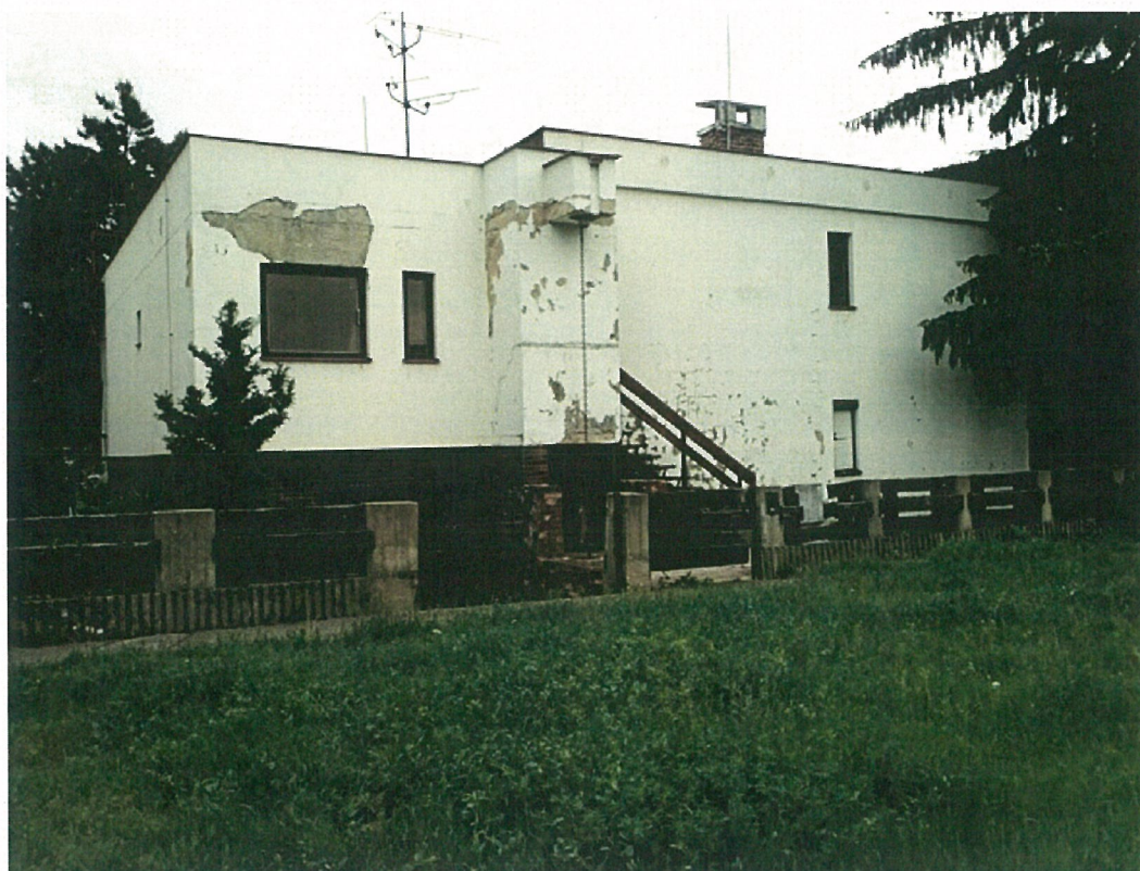
Príloha č. 1 Objekt BŽD – fotodokumentácia súčasného stavu