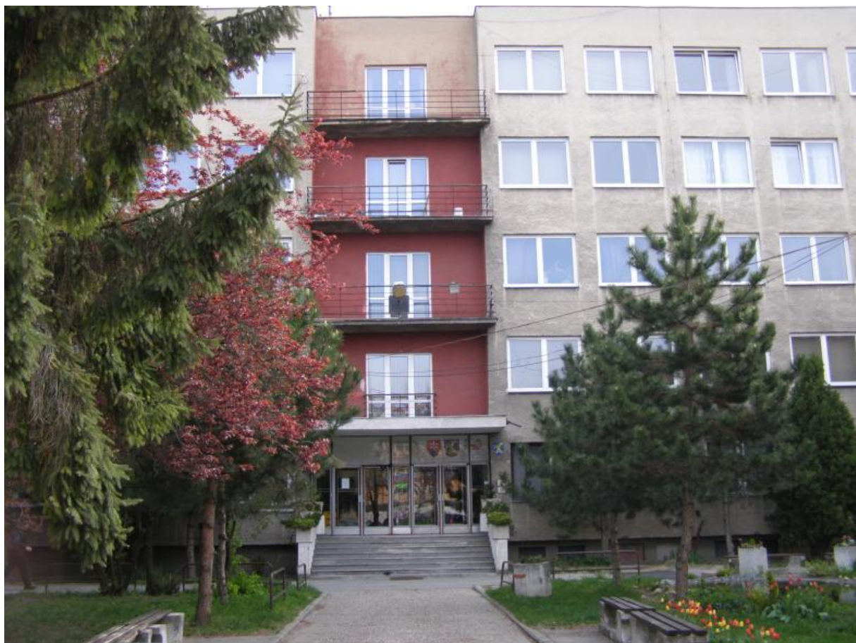
budova školského internátu (lv.cetsa 25) – súpisné číslo 4348