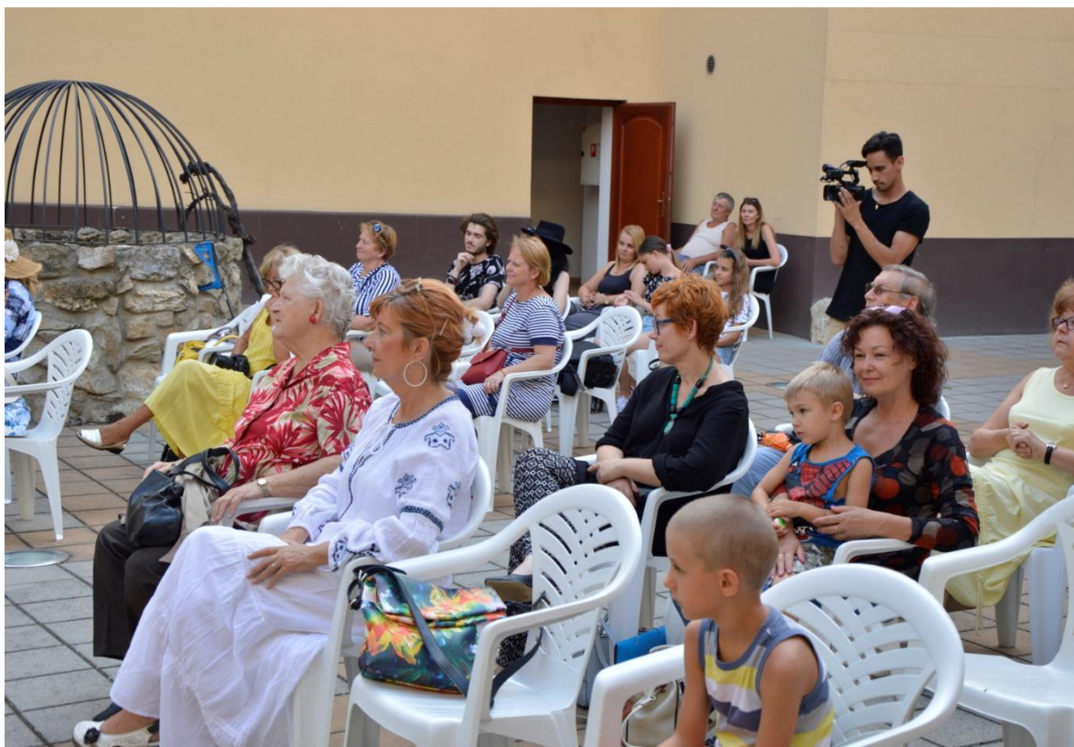
Foto archív Malokarpatskej knižnice v Pezinku, záber z podujatia Literárny kolotoč 2019

Malokarpatská knižnica v Pezinku (MKP) sídli v budove vo vlastníctve BSK na Holubyho č. 5 v Pezinku. Objekt prešiel v nedávnej minulosti čiastočnou modernizáciou, v rámci ktorej sa podarilo vybudovať bezbariérový prístup pre návštevníkov a zaviedol sa moderný elektronický evidenčný systém s bezpečnostnými portami. Knižnica výhľadovo potrebuje modernizáciu a rekonštrukciu. Vážnym rizikom pre stavebno-technický stav a životnosť budovy je suterén, ktorý bol v minulosti zasypaný stavebným odpadom a sutinou.