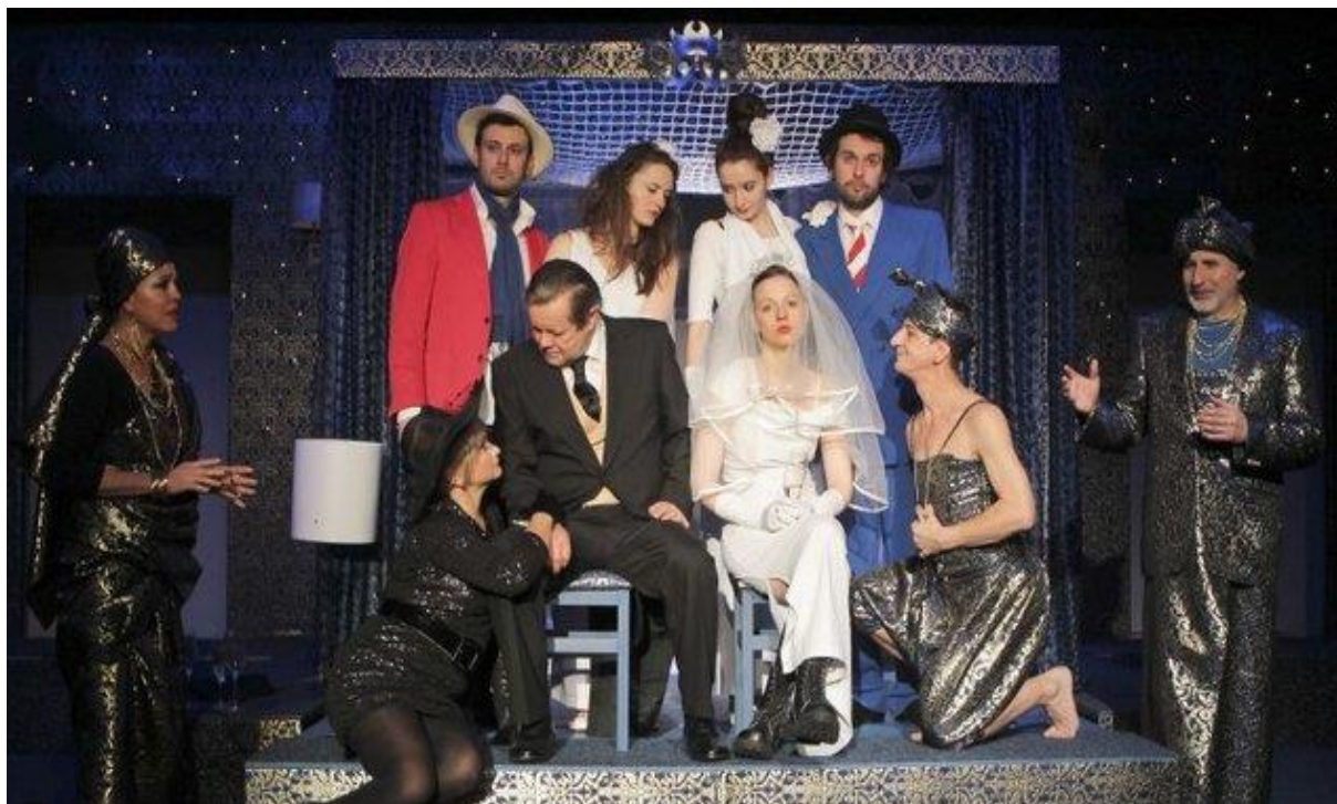
Foto archív Divadla ASTORKA KORZO´90, záber z predstavenia Sen noci svätóžánskej noci

Divadlo ASTORKA KORZO´90 (DAK´90) vzniklo 1. apríla 1990 v gescii Ministerstva kultúry SR. V roku 1993 bolo premenované na Divadlo ASTORKA KORZO ´90 (DAK´90). S účinnosťou od 1. apríla 2002 prešlo Divadlo ASTORKA KORZO ´90 z pôsobnosti Krajského úradu do zriaďovateľskej pôsobnosti Bratislavského samosprávneho kraja.