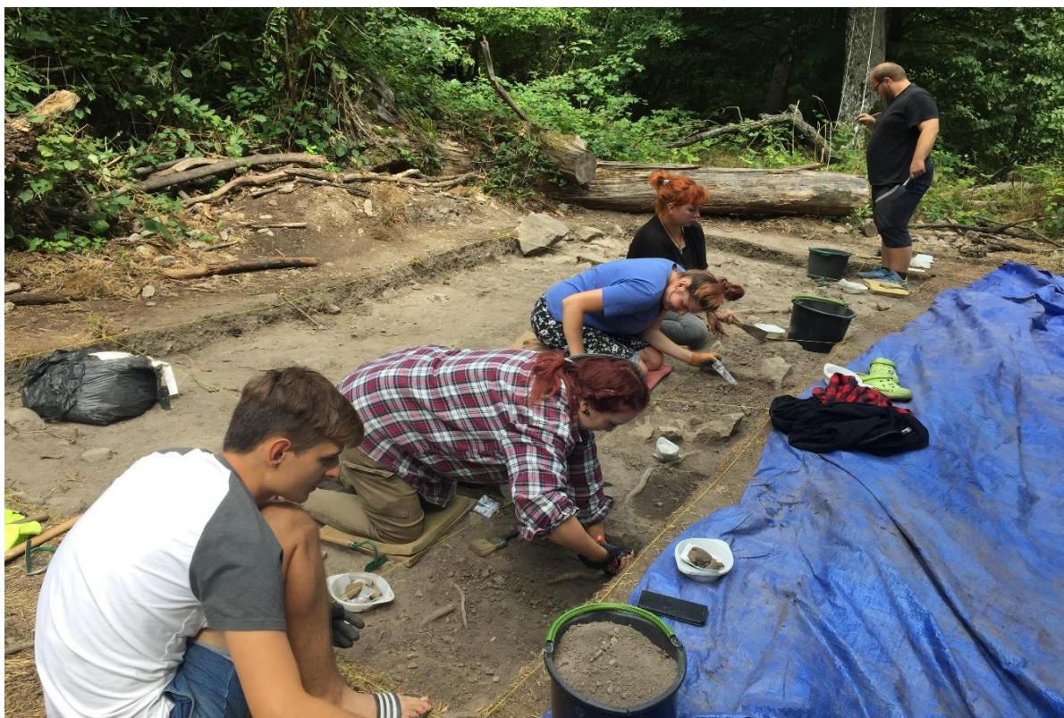
archeologický výskum na hradisku v lokalite Neštich, Svätý Jur, 2019

Malokarpatské múzeum v Pezinku sídli v národnej kultúrnej pamiatke, v pôvodne renesančnom meštianskom dome na ulici M. R. Štefánika č. 4 v Pezinku. Napriek tomu, že budova bola v roku 2007 rekonštruovaná, priestorovo a kapacitne nevyhovuje. Múzeum nemá priestory pre konzervátorské pracovisko, depozitáre sú stiesnené, nemá bezbariérový prístup pre návštevníkov. Plánovaným riešením je adaptácia podkrovia a prístavba schodiska a výťahu. Najväčším problémom a zároveň prioritou sídelnej budovy múzea v Pezinku sú nedostatočné priestory a kapacita toaliet. V roku 2019 múzeum pripravovalo projektovú dokumentáciu k plánovanej rekonštrukcii podkrovia, ktorá by aspoň čiastočne priestorové problémy zmiernila. Zámerom je vybudovať depozitár pre archeológiu, administratívu, registratúrne stredisko, priestor pre správcu budovy a najmä stabilnú prednáškovú miestnosť.