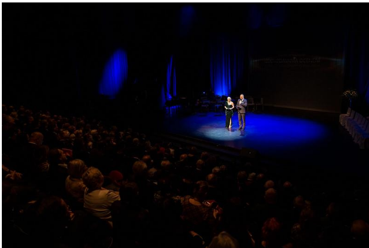
Divadlo ARÉNA, Odovzdávanie Cien Samuela Zocha, december 2019

Divadlo ARÉNA sídli v historickej budove z roku 1898 na petržalskom nábreží Dunaja (Viedenská cesta č. 10). Objekt budovy je národnou kultúrnou pamiatkou a je situovaný na mieste, kde v minulosti stál jeden z najstarších divadelných stánkov v Bratislave – amfiteáter s rovnakým názvom z roku 1828. Budova divadla je vo vlastníctve Bratislavského samosprávneho kraja. Maximálna kapacita veľkej divadelnej sály je 318 divákov, pri štandardnej úprave hľadiska a javiska je to 264 miest. Štúdiový divadelný priestor Loft Aréna ponúka miesta pre cca 80 divákov. Divadlo nemá stály umelecký súbor.