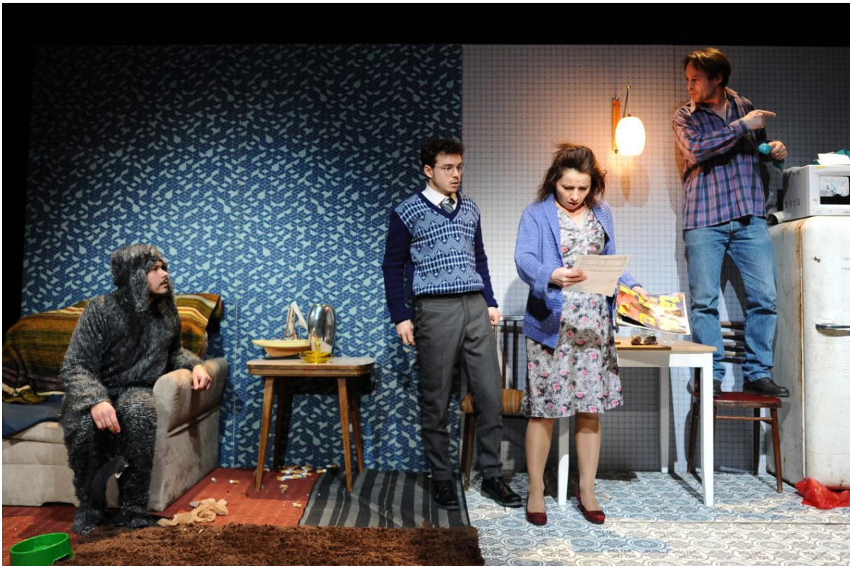
záber z predstavenia Tajný denník Adriana Mola