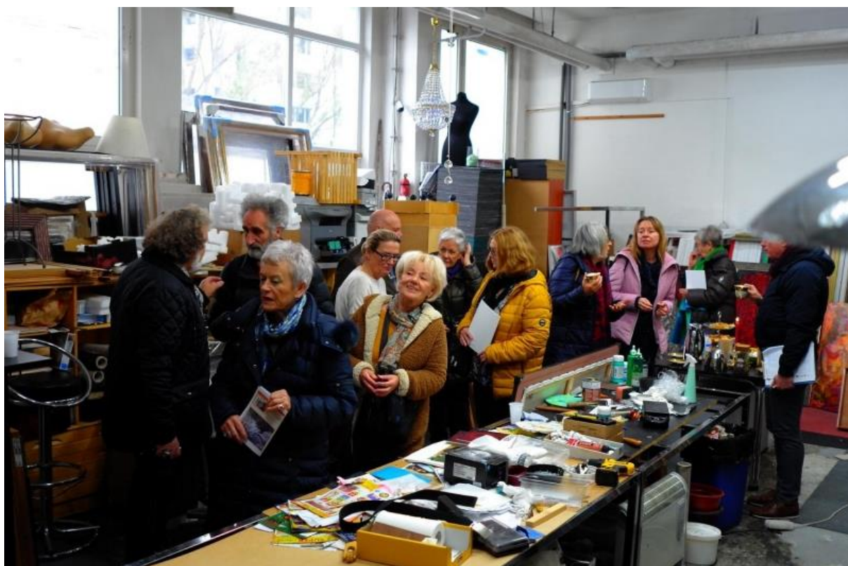
Deň otvorených ateliérov 2019

Malokarpatské osvetové stredisko v Modre (MOS) pôsobí už od roku 2003 v historickej budove kaštieľa na Hornej ulici č. 20 v Modre. Objekt ako aj príľahlá záhrada sú národnými kultúrnymi pamiatkami. Od roku 2017 sa v objekte realizuje projekt „Kultúrno-kreatívne oživenie tradícií“ v rámci projektu Heritage SK-AT, ktorý je financovaný z programu cezhraničnej spolupráce Interreg V-A Slovenská republika – Rakúsko. Cieľom projektu je vybudovať v kaštieli moderné kreatívne centrum na podporu rozvoja tradícií, čím sa obohatí funkcia a ponuka služieb Malokarpatského osvetového strediska. Súčasťou projektu je aj rekonštrukcia kaštieľa a parkovej záhrady. V roku 2019 projekt pokračoval položením strešnej krytiny, čo značne uľahčilo stavebné práce v zimnom období. Z kaštieľa sa stane po ukončení prác moderné kultúrno-kreatívne centrum regiónu s výstavnými priestormi, vinotékou, digitalizačno - dokumentačným pracoviskom a študovňou. Projekt rekonštrukcie zahŕňa okrem rekonštrukcie kaštieľa aj revitalizáciu záhrady. Ukončenie stavebných prác je naplánované na koniec roka 2020. V rámci projektu vzniká aj samostatné digitalizačné pracovisko, v ktorom odborní pracovníci digitalizujú vybrané predmety historického a kultúrneho významu z celého Bratislavského kraja. Každý zdigitalizovaný predmet je zdokumentovaný v 2 D rozmere a má spracovaný popis, je zaradený do databázy, ktorá sa bude v budúcnosti rozrastať a uchovať pre ďalšie generácie.