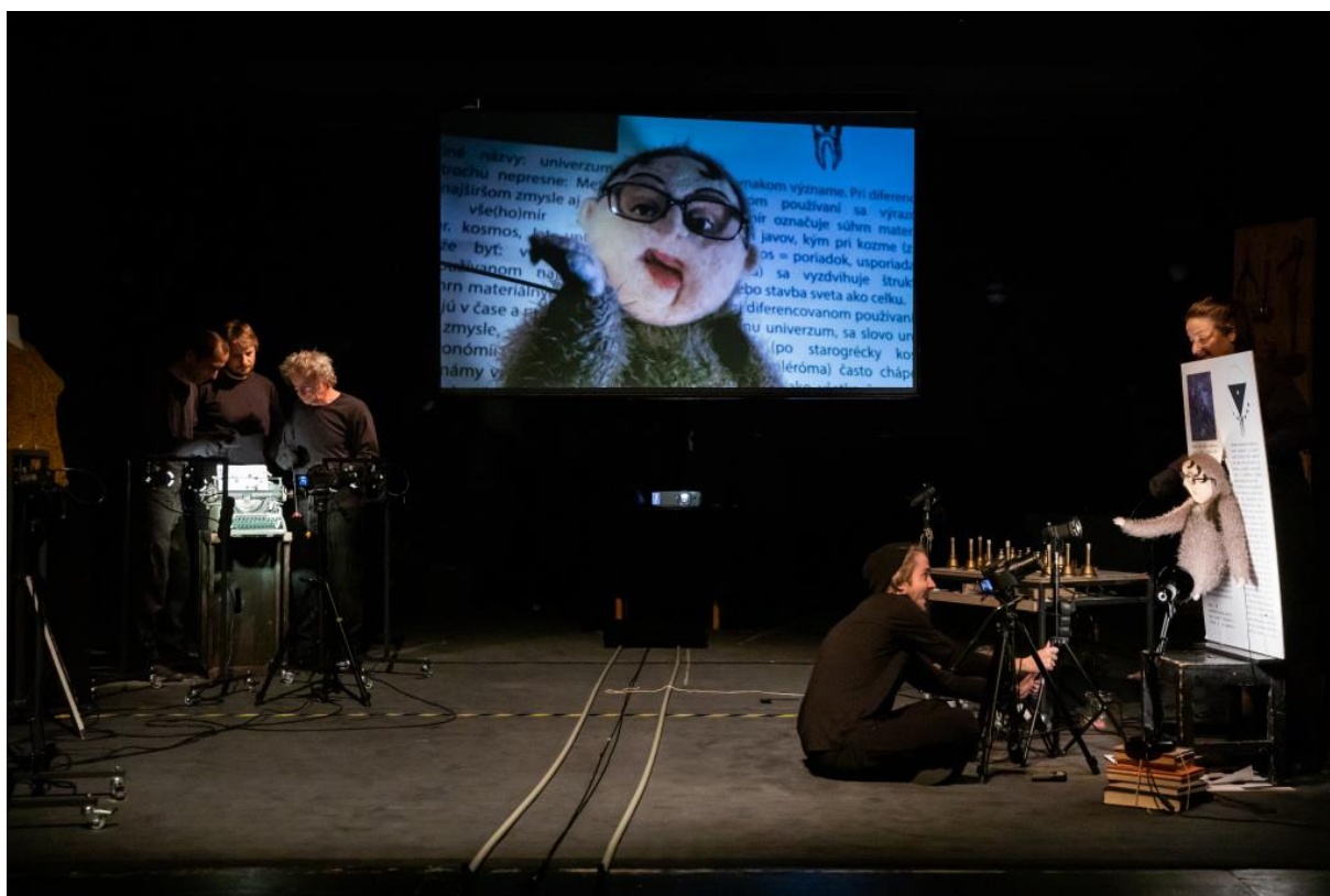
záber z predstavenia Chronoškratkovia,

Sídelnou budovou Bratislavského bábkového divadla (BBD) je historický spolkový dom na Dunajskej ulici č. 36 v centre Bratislavy. Budova je v zlom stavebnotechnickom stave a v súčasnosti prebieha proces rekonštrukcie objektu. Proces rekonštrukcie zdržala náročná aktualizácia projektovej dokumentácie. Pre formálne a vecné pochybenia musel BSK ako zriaďovateľ divadla zrušiť dve verejné obstarávania na zhotoviteľa stavebných prác a rekonštrukcie. Tretie verejné obstarávanie bolo úspešné s predpokladom začiatku stavebných prác v druhom štvrtroku 2018. Po podpísaní zmluvy s víťaznou firmou VO Euro-Bulding a. s., v zmysle výsledkov z verejného obstarávania, sa v apríli 2018 začalo s búracími prácami na divadelnej časti budovy. Pri týchto prácach sa zistilo, že obvodový múr javiska a hľadiska nemá dostatočné základy. Na základe statického posudku bola stavba pozastavená. Na asanáciu existujúceho nosného obvodového muriva javiska a hľadiska bolo následne vypísané nové verejné obstarávanie. Firma Euro-Bulding a. s. na základe dohody vypovedala zmluvu a odovzdala stavenisko objednávateľovi. V roku 2019 dodávatelia dokončili búracie práce zadného traktu divadla a projektant dokončil revitalizáciu projektovej dokumentácie. Zo strany BSK bolo potrebné zabezpečiť nové stavebné povolenie a vyžiadať ďalší súhlas z Krajského pamiatkového úradu, pripravilo sa vypísanie nového verejného obstarávania rekonštrukcie divadla.