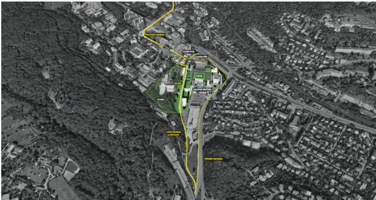
Obr. 6: II. Fáza zámeru