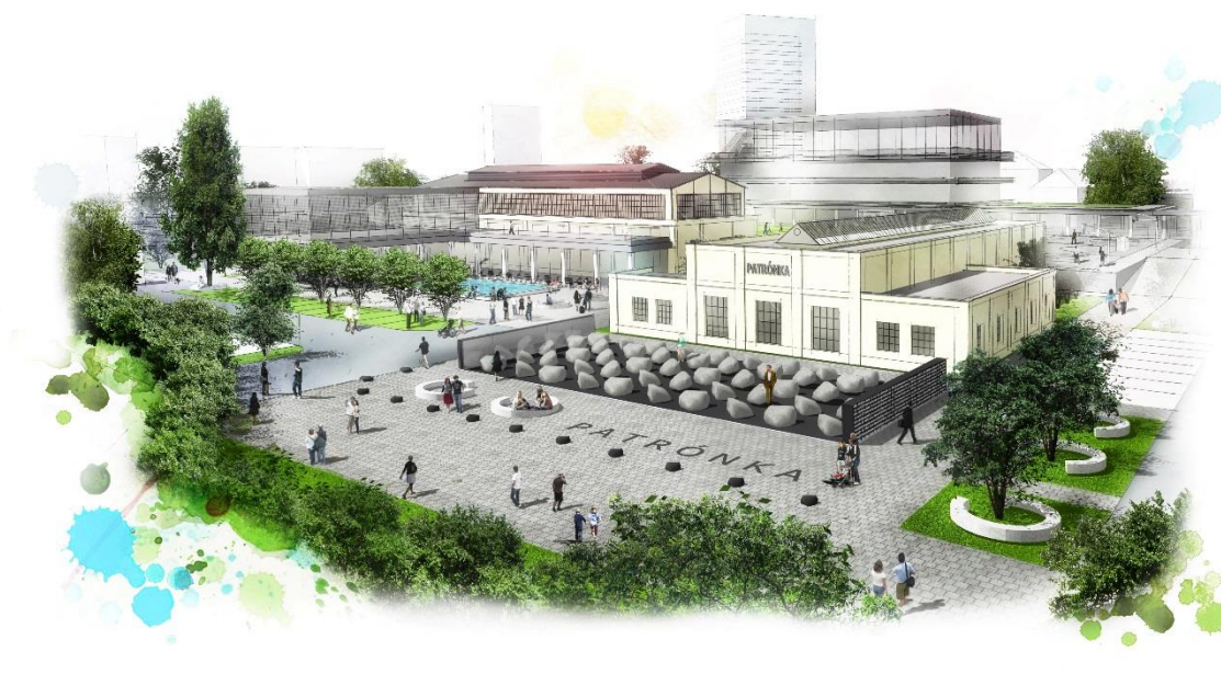
Obr.5: Vizualizácia cieľového stavu – pohľad na pamätník s novým námestím

Centrálné športovisko s viacerými multifunkčnými ihriskami, so zázemím – šatňami a tribúnou a plne debarierizované