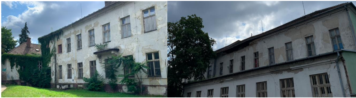
Obr.4.: Havarijný stav budovy v nájme Odborného učilišťa

MČ BA Karlova Ves – záväzky voči mestskej časti spočívajú v oblasti športovej infraštruktúry – futbalového ihriska a telocvične, ktoré má m.č. v dlhodobom nájme. V tomto prípade sa postupovalo nasledovne - v novom rozvojom projekte bude naďalej vlastníkom centrálného športoviska BSK, ktoré však bude rozdelené na viaceré multifunkčné plochy a teda bude môcť slúžiť viacerým športovým aktivitám aj obyvateľom MČ BA Karlova Ves. Zároveň v prípade futbalového ihriska pristúpi BSK ku komplexnej revitalizácii futbalového ihriska v areáli Strednej priemyselnej školy elektrotechnickej K. Adellera, kde sa prirodzene vytvorí zázemie aj pre mládežnícky futbal Karlovej Vsi.