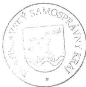
Ing. Pavol Frešo predseda Bratislavského samosprávneho kraja