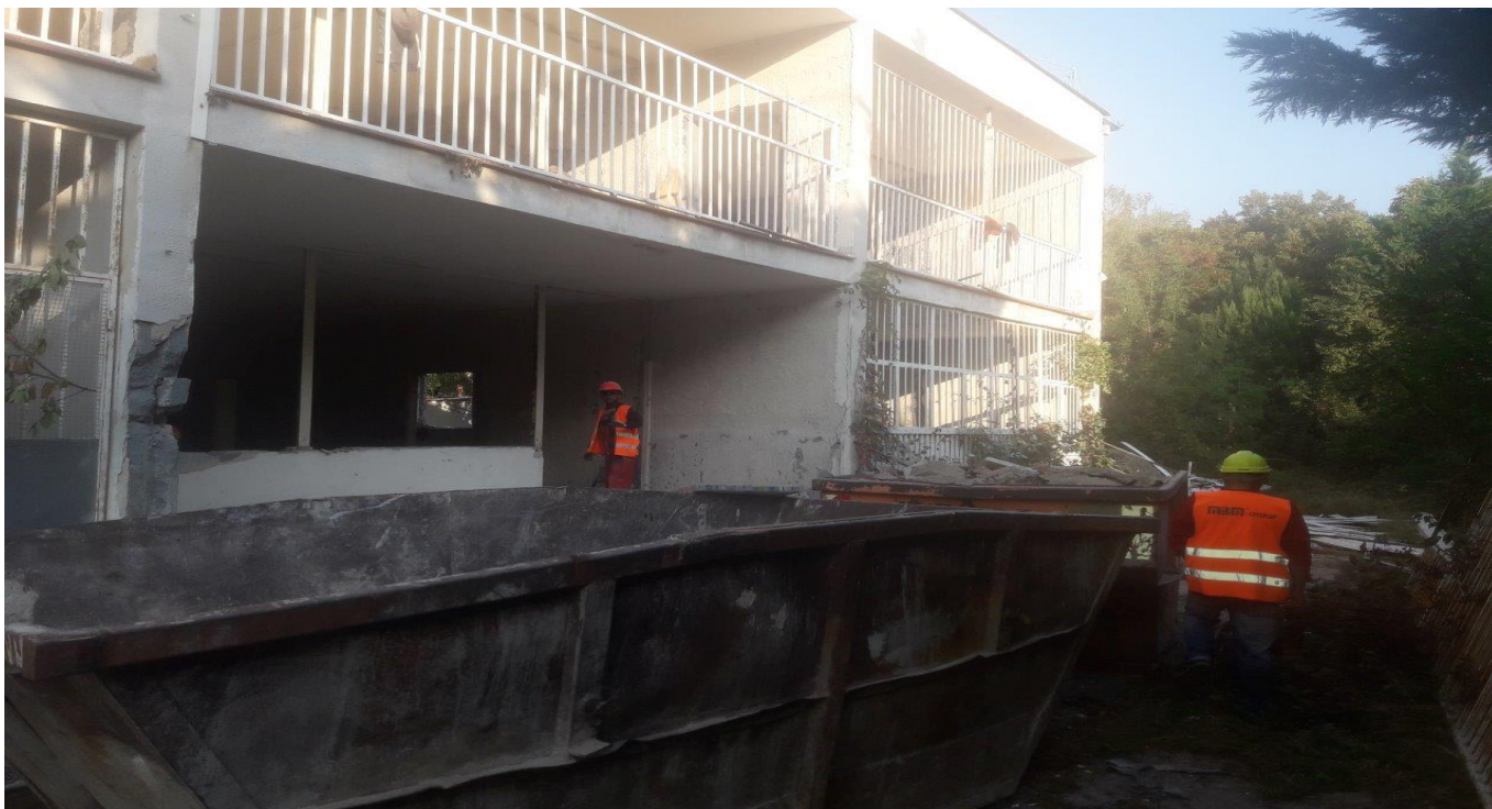
Rekonštrukcia Strelkova 2