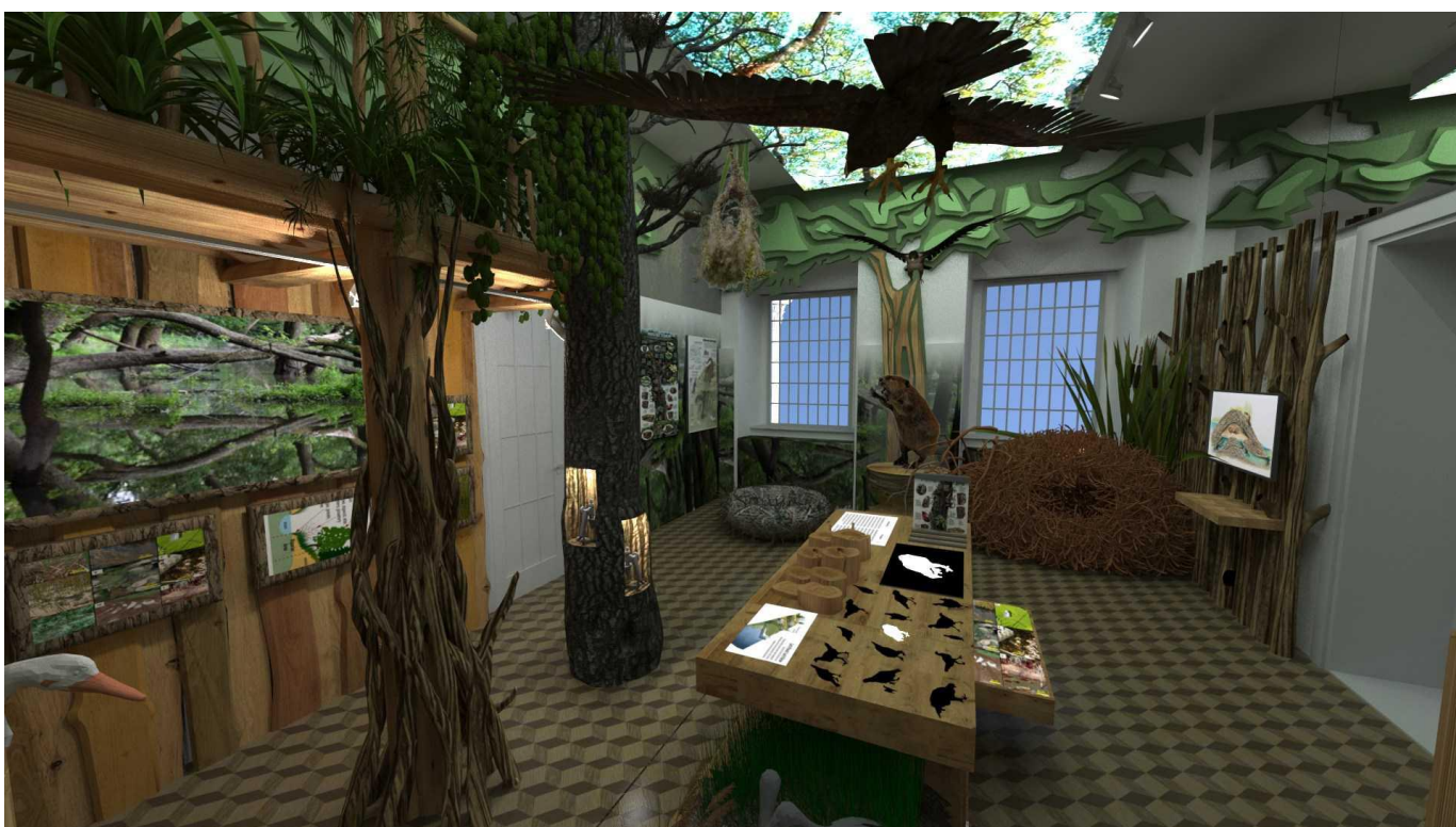
Vizualizácia tematickej expozície v novovybudovanom Ekocentre Čunovo