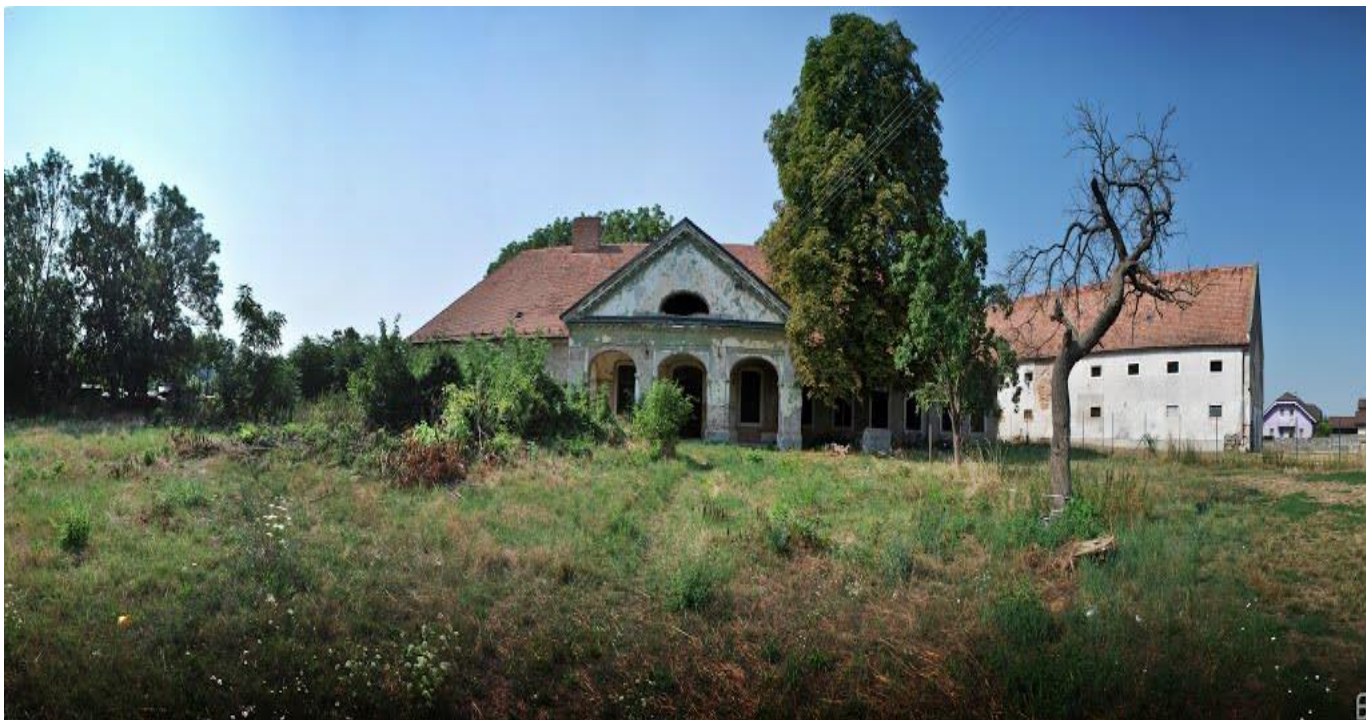
NKP Kaštieľ Čunovo v súčasnosti