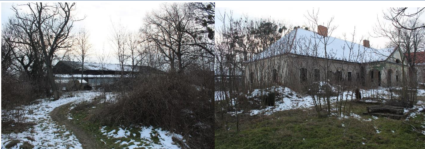
Záhrada za NKP Kaštieľ Čunovo v súčasnosti