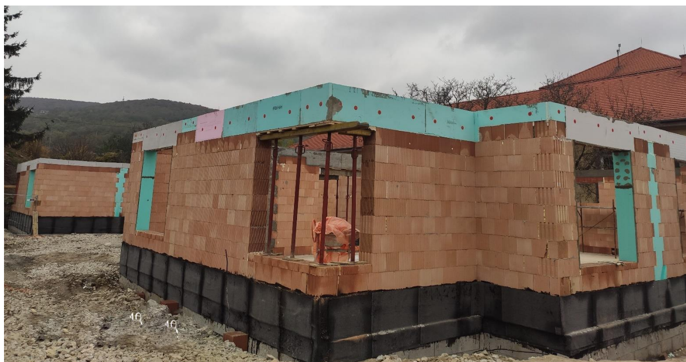
Výstavba Račianska 105