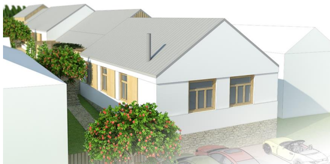
Obr. Novostavba Dubová - vizualizácia

Zároveň bol začiatkom roka 2021 spustený proces spracovania Koncepcie inklúzie Rómov na území BSK v spolupráci s organizáciami pôsobiacimi v uvedenej oblasti