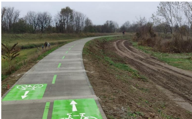
Obr. Projekt SacraVelo

stanovený na 2 538 651,01 EUR, pričom na aktivity BSK boli z tohto rozpočtu vyčlenené finančné prostriedky vo výške 756 021 EUR. Projekt BSK ďalej spolufinancoval 5 % spoluúčasťou, čo predstavuje 37 801,05 EUR, a tak isto bolo zaplatené z rozpočtu BSK dofinancovanie projektu v sume 40 768,56 EUR. Realizácia projektu sa začala v roku 2018 pričom v prvom kvartáli roka 2019 bola dobudovaná cyklotrasa medzi obcami Vajnory a Ivanka pri Dunaji. Stavebné práce na cyklotrase JURAVA II boli ukončené a stavba prevzatá dňa 31. 1. 2019. Projekt bol oficiálne ukončený v apríli 2021 záverečnou konferenciou.