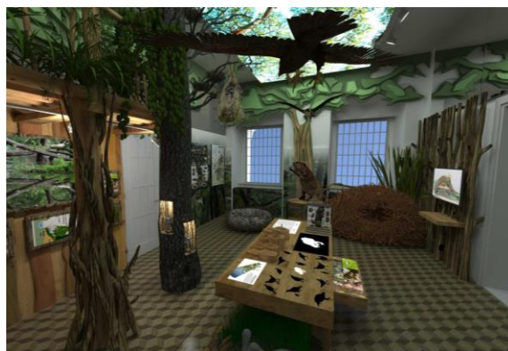
Obr. Vizualizácia tematickej expozície v Ekocentre Čunovo