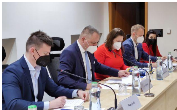
Obr. 3. Zasadnutie Rady partnerstva 14.04.2021