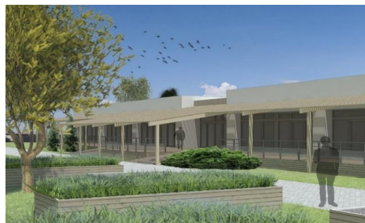
Obr. Rekonštrukcia Kráľová - vizualizácia