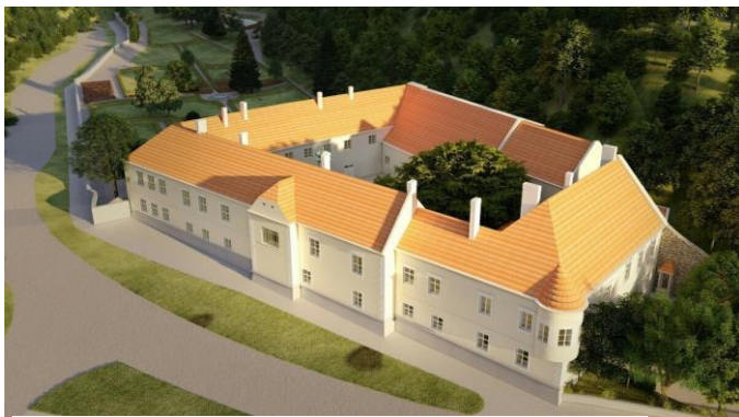
Obr. Vizualizácia kaštieľa a parku v Modre

Vo februári 2020 zorganizoval BSK spolu s partnermi odbornú konferenciu na tému „Tradičné remeslá včera a dnes“. Cieľom bola diskusia o rekonštrukcii kaštieľa v Jedenspeigene a prínose digitalizácie pre zachovanie kultúrneho dedičstva. Na konferencii sa predstavili speakri zo Slovenska a Rakúska. V období od 10.10.2019 do 28.03.2020 bola realizovaná spoločná „Výstava o víne a výrobe vína“. Súčasne sa v priebehu roka 2020 pokračovalo na zabezpečení technologického vybavenia pre Digitálno-Dokumentačné centrum. Dňa 10.9.2020 bola zorganizovaná odborná degustácia festivalu vín „Rizlingov rýnskych“, kde odborná porota zložená z rakúskych a slovenských degustátorov, hodnotila 57 vzoriek (výsledkom je 16 Zlatých a 26 strieborných ocenení, ďalšie vína získali bronzové ocenenia).