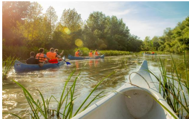
Obr. Projekt DANUBE BIKE & BOAT