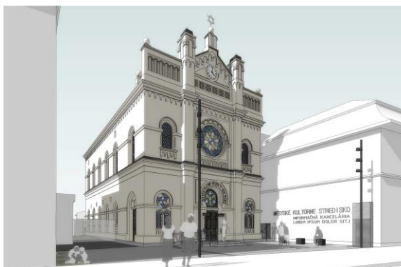
Obr. Vizualizácia rekonštrukcie synagógy Senec

Aktivitami projektu sú rekonštrukcia NKP synagógy v Senci, vybudovanie novostavby infopavilónu, úprava areálu synagógy za účelom vytvorenia priestoru pre kultúrno-spoločenské aktivity, vytvorenie regionálneho kultúrno-spoločenského centra ako priestoru pre prezentáciu stredných a vysokých škôl umeleckého zamerania a expozícia židovskej kultúry. V rámci projektu bola v roku 2016 dodaná interiérová štúdia, bolo vyhlásené verejné obstarávanie na dodávateľa stavebných prác a bola podaná žiadosť o nenávratný finančný príspevok z programu INTERREG V-A Slovenská republika – Maďarsko 2014 - 2020. V priebehu roka 2017 však nebol schválený nenávratný finančný príspevok z programu INTERREG V-A Slovenská republika – Maďarsko 2014 – 2020, z toho dôvodu bol projekt financovaný z rozpočtu BSK, pričom rozpočet predstavoval sumu 1 584 091,92 EUR. Realizácia projektu začala v roku 2018. V priebehu roku 2019 bola dokončená fasáda hlavného objektu, vnútorná omietka a drevená stropná konštrukcia infopavilónu vrátane hydroizolácie, chodba pri infopavilóne, vonkajšie rampy, hrubá stavba spojovacej chodby, a pokračovalo sa