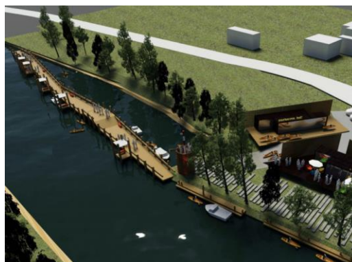
Obr. Projekt KOZRO ZÁLESIE