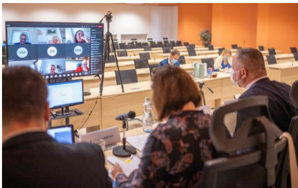
Obr. Ustanovujúce zasadnutie Rady partnerstva 18.11.2020

Samotný vznik a začiatok činnosti Rady partnerstva BSK spadá do druhej polovice roka 2020. Rada partnerstva predstavuje regionálnu platformu, zloženú z 56 členov zastupujúcich jednak samosprávny kraj, miestnu územnú samosprávu (mestá, obce a združenia obcí) a štát, ale aj podnikateľský a akademický sektor, školstvo a občiansku spoločnosť v našom území. Je zodpovedná za prípravu a implementáciu ISÚ na roky 2021 – 2027, ktorá predstavuje implementačný nástroj Programu hospodárskeho rozvoja a sociálneho rozvoja pre BSK (ďalej len „PHRSR BSK“) vo vzťahu k využitiu EŠIF, prípadne iných externých zdrojov. Bude slúžiť na schvaľovanie vybraných projektových zámerov určených na financovanie v novom programovom období 2021-2027. Od decembra 2020 do marca 2021 prebiehala aktualizácia projektových zásobníkov miest, obcí, mestských častí a sociálno-ekonomických partnerov. Následne boli zástupcovia v Rade partnerstva a tematických komisiách informovaní o kľúčových oblastiach podpory rozvoja jednotlivých okresov BSK, ktoré vzišli z projektových zásobníkov a analýzy územia. V súčasnosti prebieha proces tvorby multikriteriálnej analýzy.