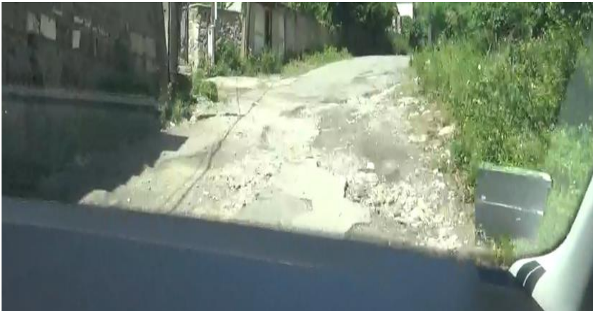
Cesta III/1108 Borinka - Košariská

Oprávnená osoba na základe tvrdenia povinnej osoby, že stredové čiary sú v rámci BSK upravované pred a po zimnej sezóne, konštatuje, že má zachytenú realizáciu