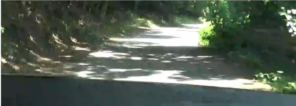
MAH326 III/1108 smer Košariská