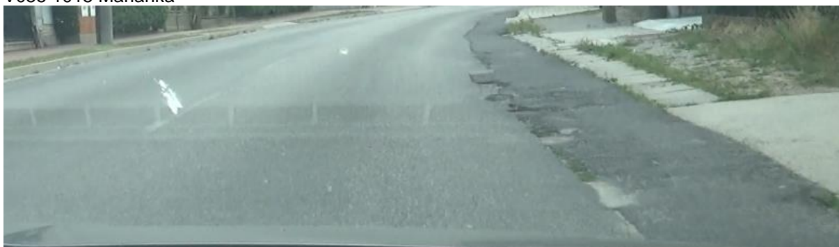
V055 1015 Marianka