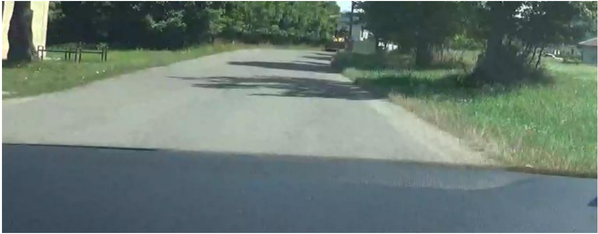
MAH 318 III/1108 z Borinky na Košariská