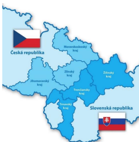
Obrázok 3 Programové územie Interreg SK-CZ

Podobne ako predchádzajúce programy cezhraničnej spolupráce, tak aj Interreg SK-CZ plánuje v programovom období 2021-2027 podporovať aktivity v oblasti životného prostredia, sociálnych služieb a posilnenia úlohy kultúry a udržateľného cestovného ruchu.