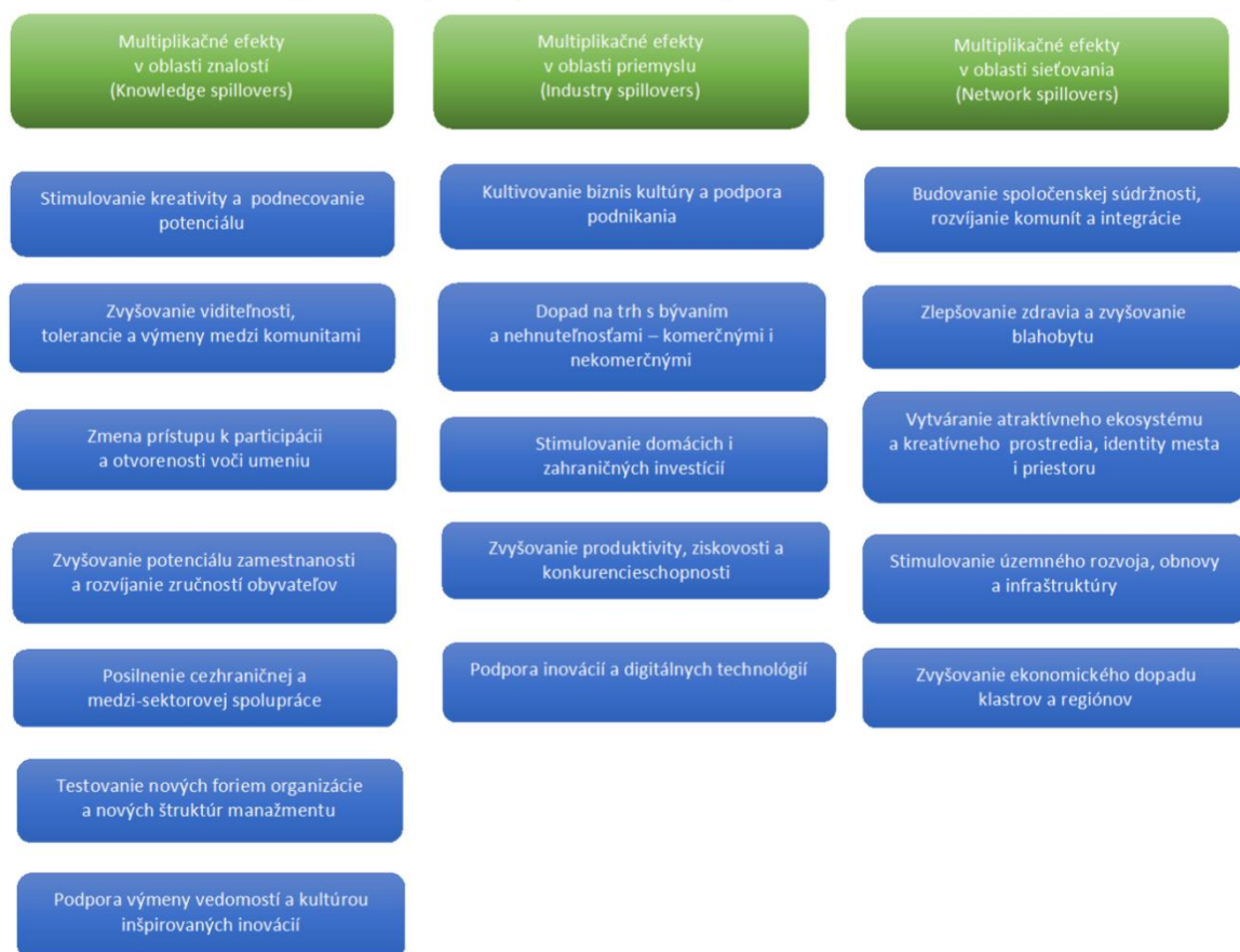
Obrázok 1: Diagram multiplikačných efektov a ich podkategórií