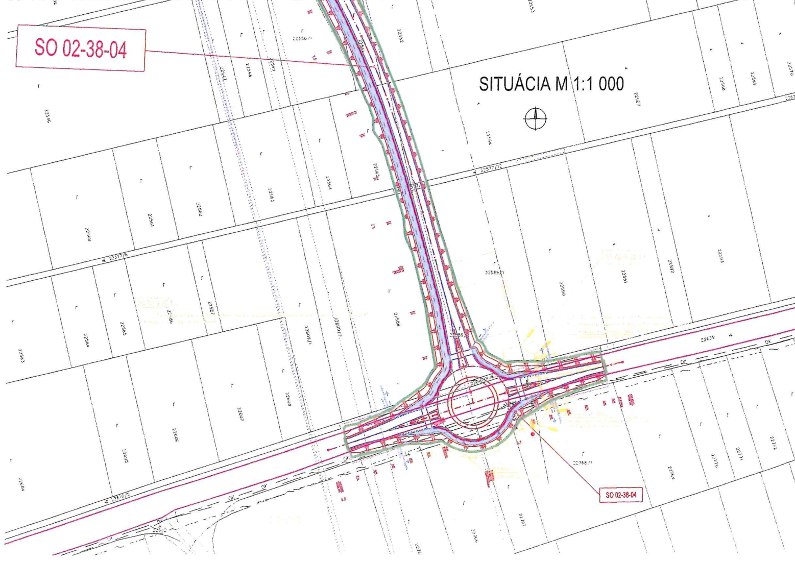
SITUÁCIA M 1:1 000